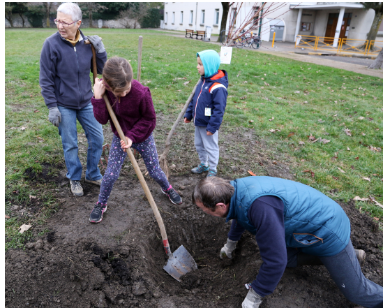
Plantation du verger collectif Salengro

Plantation d'un nouveau verger collectif parc Salengro