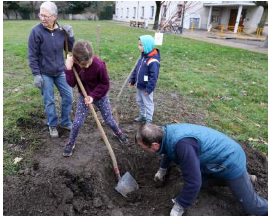
Plantation du verger collectif Salengro

Plantation d'un nouveau verger collectif parc Salengro