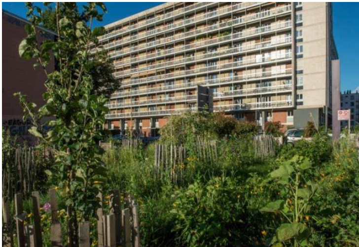
Le verger Essen'ciel à Catane

Subvenir à ses besoins alimentaires et créer du lien social