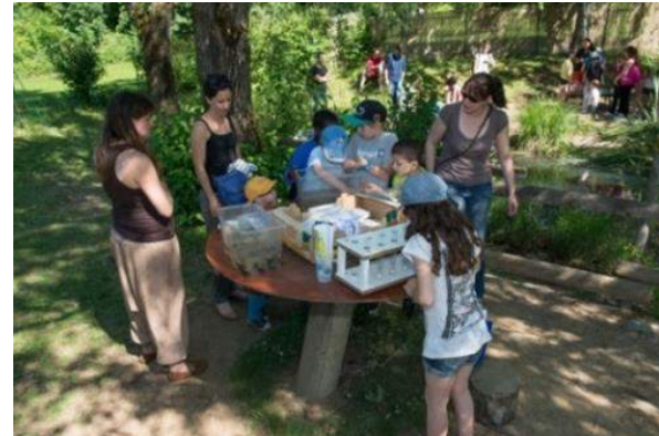
L'évènement « C'est la récré ! » à la Maison des Collines