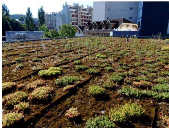
Toit de l'école Lucie Aubrac