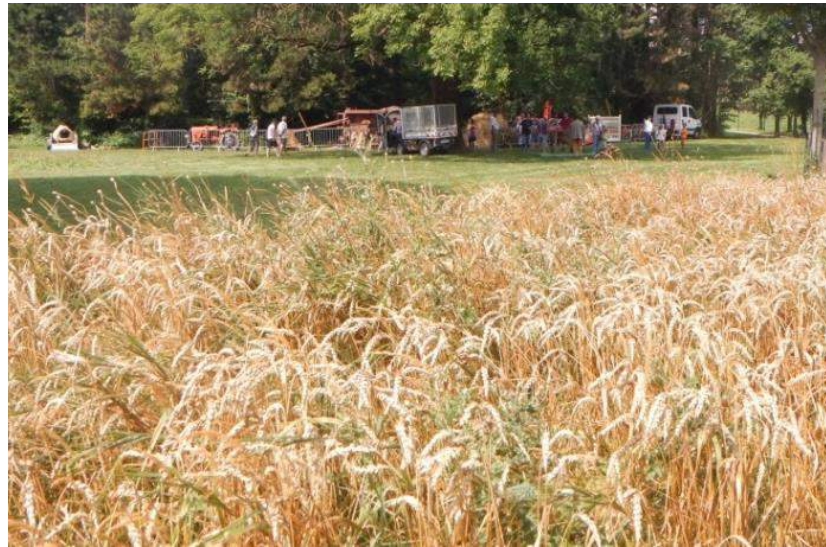
« Fête des Moissons » au Parc de la Villeneuve en juillet 2016