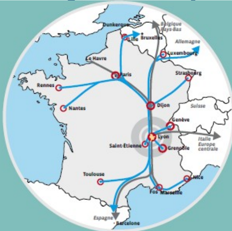
LYON AU CŒUR DES GRANDS AXES FRET ET VOYAGEURS

« Nœud Ferroviaire Lyonnais » ? □ 12 lignes ferroviaires convergent vers Lyon