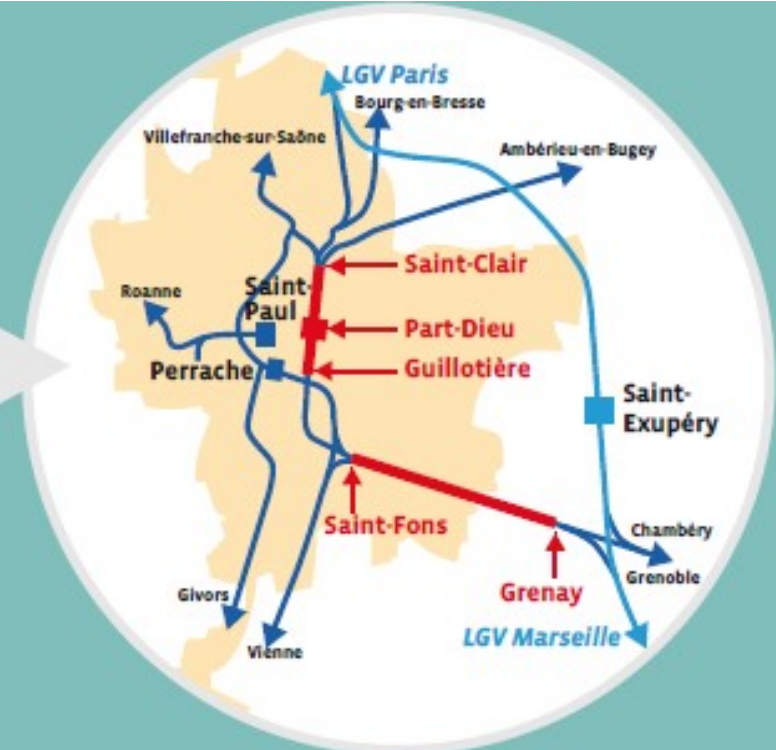
LE PÉRIMÈTRE DU PROJET